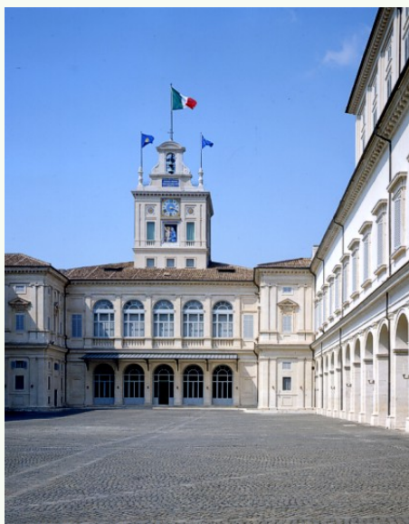
Il Palazzo del Quirinale, simbolo delle nostre Istituzioni